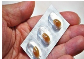
Bu ürün sayesinde milyonlarca erkek tekrar sevişebilir yapabilir!