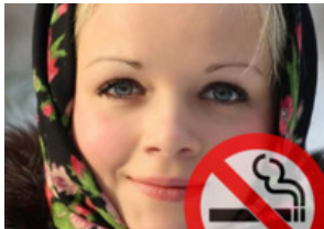
Sigarayı bırakmak mı istiyorsun? İnanılmaz yöntem: Bir bardak su al ve içine...