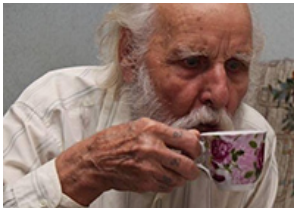
104 yaşındayım, tansiyon ve kalp sorunu nedir bilmiyorum! Çünkü...