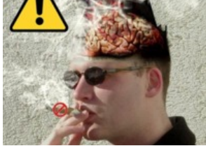
Sigarayı 3 günde bıraktım ve sırrımı arkadaşlarımla paylaştım! DEVAMINI OKU...