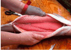
Yüksek tansiyon mu? Bunu yaparsanız tansiyonunuz 120/80 olur...

Sağlık Bakanlığı | Mobil İletişim | İlaç Kullanımı | Uluslararası Diyabet Federasyonu | Sağlık Personeli